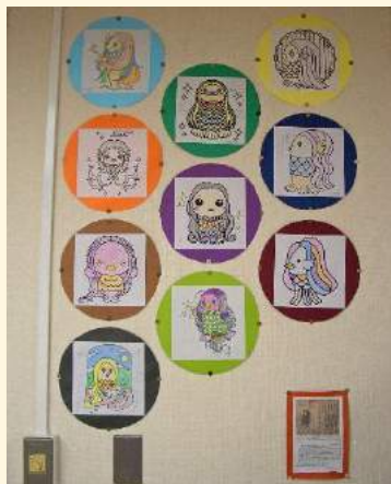
2023年作成の新バージョン

2020年の春頃に新型コロナウイルスの感染が拡大し始めた時、ご利用者の皆さんからアマビエを飾ってはどうか？との提案があり、早速色鉛筆によるアマビエの塗り絵を作成しました。