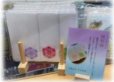
縁起袋 (さしこポチ袋) 3枚入り ¥220