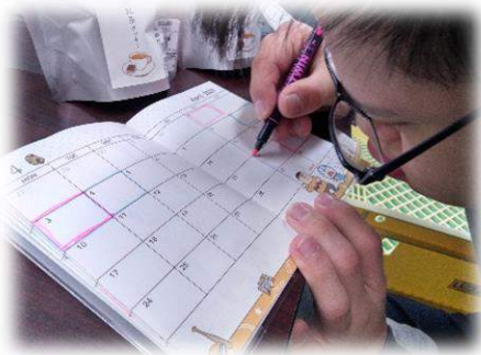
賞味期限チェックの下準備

児童デイサービスでは、ワーキングセンターのラスクやクッキーの納品を通じた、社会体験活動を土曜日に行っています。バーコード貼りや、賞味期限チェックも任せてもらっています！