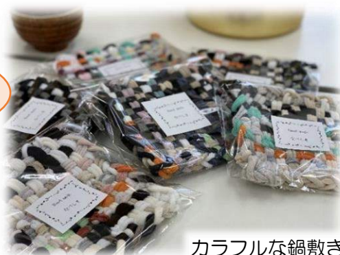
カラフルな鍋敷き