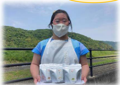
おすすめの茶処クッキーです♪